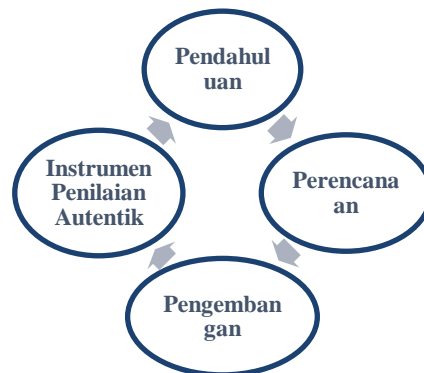
Gambar 1. Alur Penelitian Pengembangan Penilaian Autentik

penyempurnaan produk akhir ( final product revision ), dan (10) diseminasi dan implementasi ( disemination and implementation ).