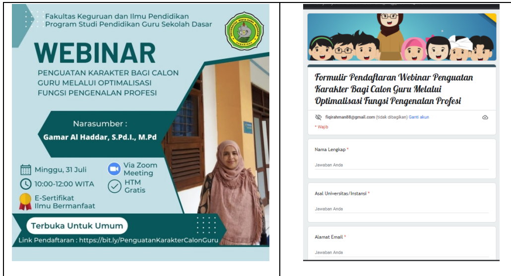
Gambar 1 : Poster Kegiatan Webinar dan Formulir Pendaftaran Kegiatan

karakter melalui optimalisasi fungsi pengenala profesi. Jumlah peserta yakni 110 orang. Kegiatan webinar dilaksanakan pada hari minggu tanggal 31 Juli 2022. Selanjutnya sharing materi dan lain lain melalui group whatsapp yang telah dibuat.