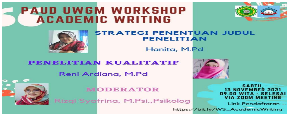
Gambar1. Koleksi panitia Workshop AW