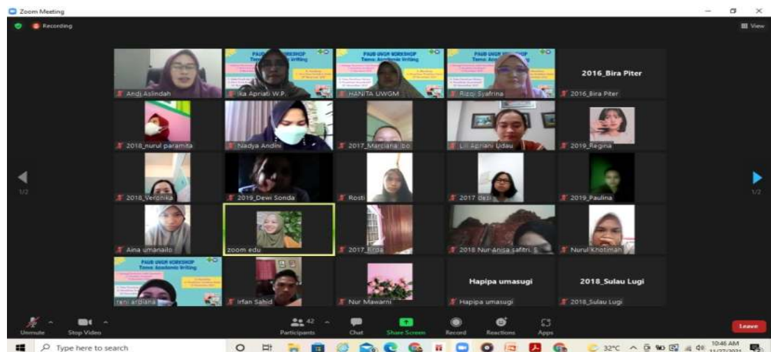
Gambar 6. Koleksi panitia Workshop Aw

Workshop Academic Writing berjalan lancar tanpa ada kendala yang berarti, juga berkat bantuan para mahasiswa sebagai panitia pelaksana kegiatan. Dengan adanya Workshop Academic Writing diharapkan mahasiswa dapat memanfaatkannya dengan baik sehingga regulasi diri dalam belajar dapat di tingkatkan dan tugas akhir yaitu skripsi dapat diselesaikan dengan baik dan tepat waktu