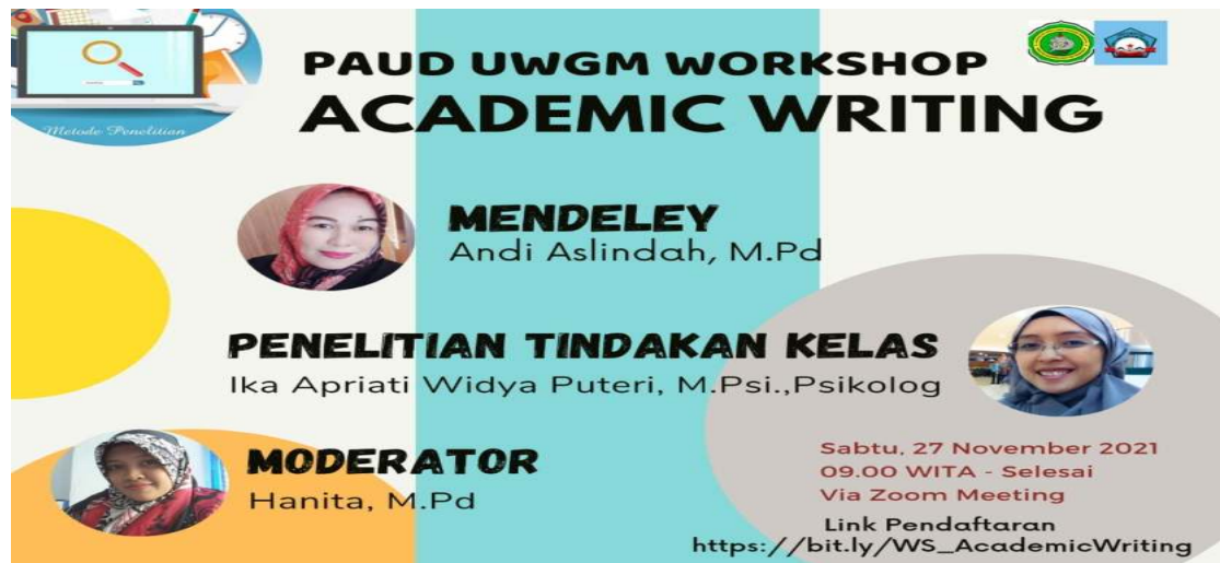
Gambar5. Koleksi panitia Workshop Aw