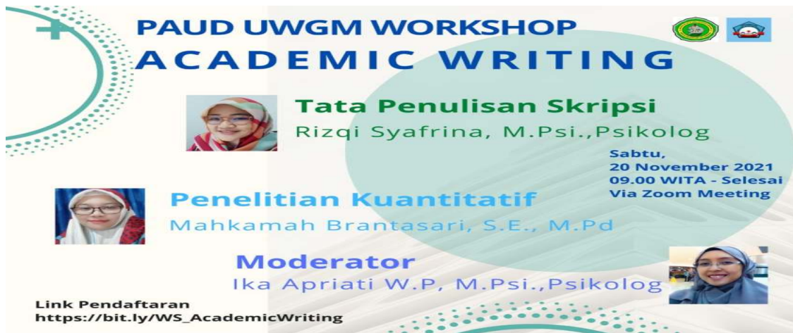
Gambar3. Koleksi panitia Workshop AW