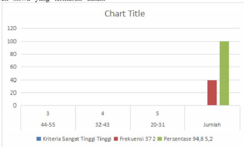
Gambar 3 Histogram Peningkatan Religiusitas

kategori sedang, rendah, dan sangat rendah. Persentase peningkatan religiusitas siswa sebelum dan setelah dilakukan pembelajaran IPS berbasis pengetahuan daur hidup manusia Kalimantan dapat dilihat dalam diagram berikut.