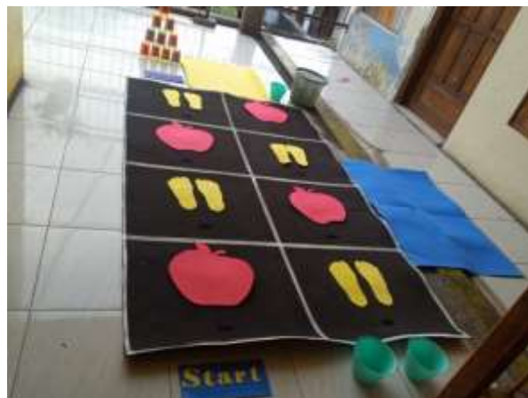
Gambar 2 Media permainan jejak susun angka sebelum validasi